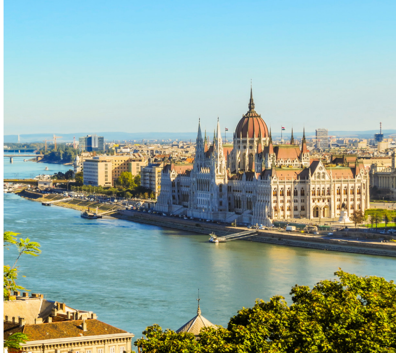
Parlamentsbygningen i Budapest