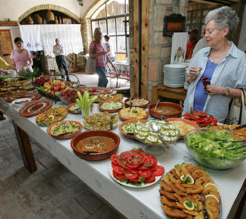
Lunsj i Jarak