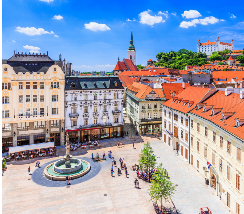
Gamlebyen i Bratislava