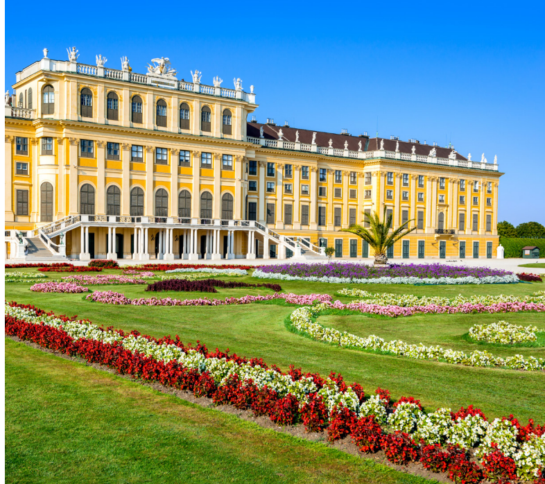
Schönbrunn-slottet i Wien

utvendige og innvendige bassenger, som alle holder 38 grader. Budapest er også en fin by for shopping. Vanligvis ligger skipet i gangavstand fra gågaten Váci utca og i enden av den finner du den store markedshallen Nagycsarnok, Budapests største innendørs matmarked. Selve markedshallen er bygget i Jugendstil og stod klart i mars 1897. Mest imponerende er kanskje det store utvalget av ungarsk mat og vin man finner i hallen.